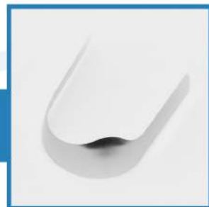
WZÓR 29 - trzonowe obustronne