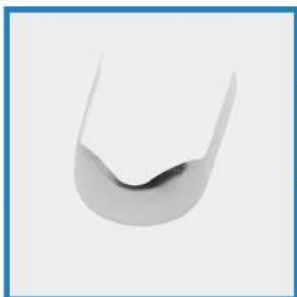
WZÓR 24 - trzonowe prawostronne