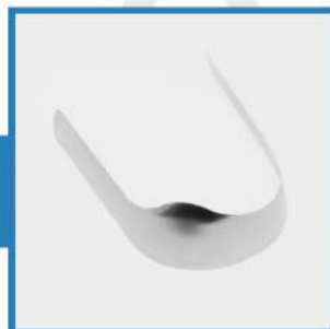
WZÓR 20 - asortyment